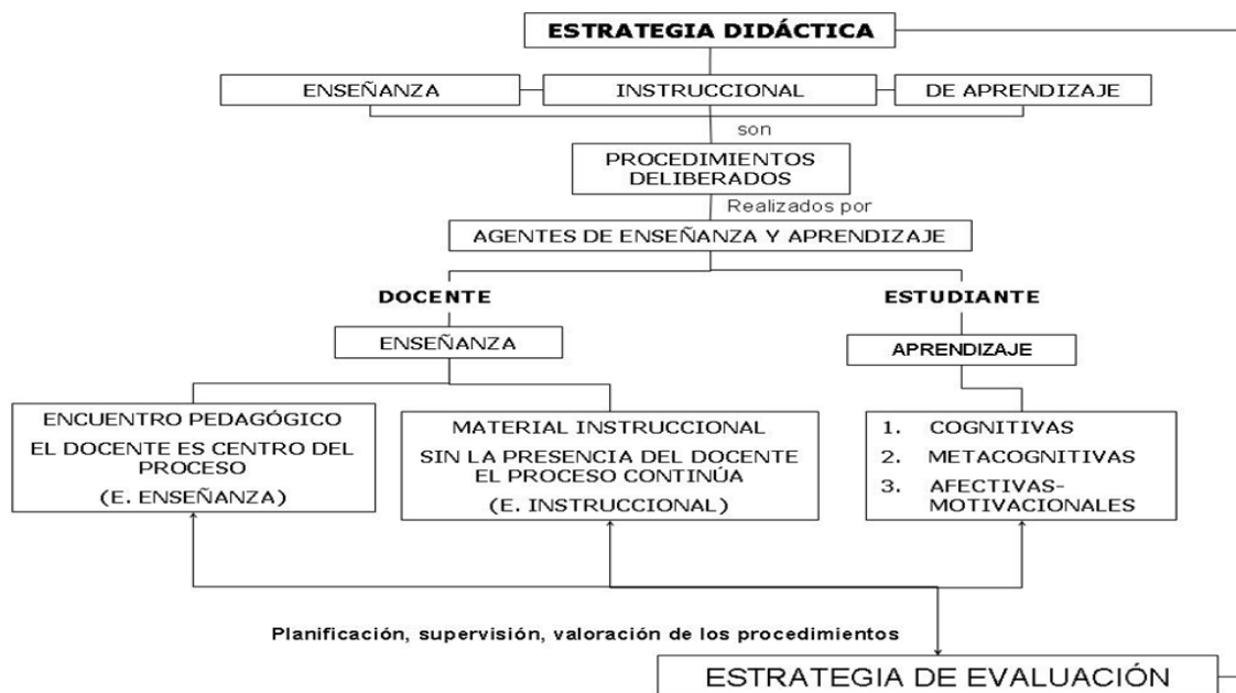
Gráfica 1. La estrategia didáctica, su clasificación.