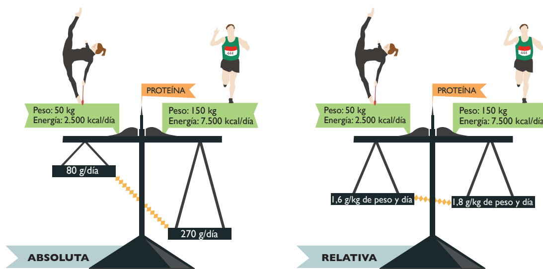
Figura 1. Ejemplo de ingesta absoluta y relativa de proteínas en deportistas

Como se ha mencionado anteriormente, desde el punto de vista del deporte y la competición, en algunas modalidades deportivas el peso corporal es un condicionante importante del rendimiento o de la propia participación. Deportes como el culturismo, la gimnasia artística o