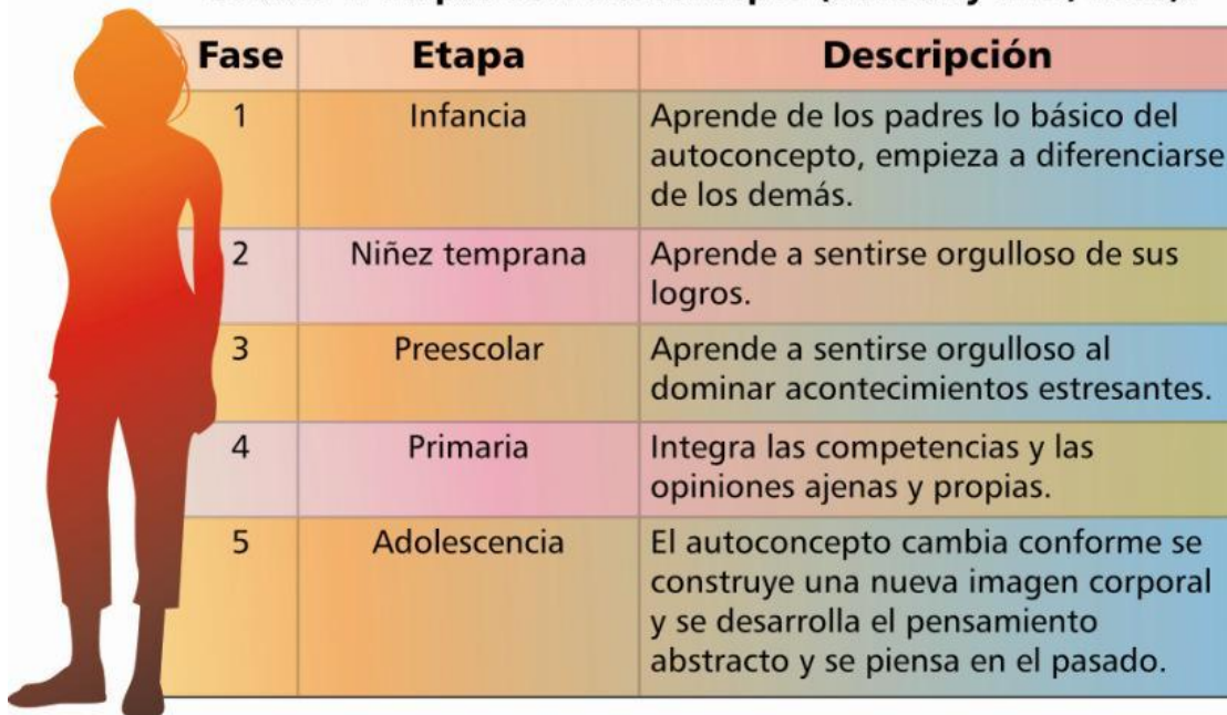
Cuadro 1. Etapas del Autoconcepto (Henson y Eller, 2000).

Entendemos por autoconcepto: “una colección organizada de sentimientos y creencias sobre uno mismo” (en Barrios Cepeda, 2005).