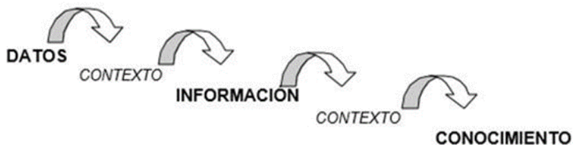
Figura 1. Relaciones entre datos, información y conocimiento

La función de los sistemas de información es captar, transformar y mantener tres niveles concretos: datos sin procesar, datos procesados y conocimiento. Los datos procesados, tradicionalmente denominados información, transmiten conocimiento acerca de un tema particular. El conocimiento representa un concepto intelectual de un orden mayor, en el que las pruebas y la información de diversos campos y fuentes se vinculan, validan y correlacionan con verdades científicas establecidas y, por lo tanto, se convierten en un acervo generalmente aceptado de conocimientos. Podríamos decir que la información comprende datos en contexto y el conocimiento es la información en contexto (figura 1).