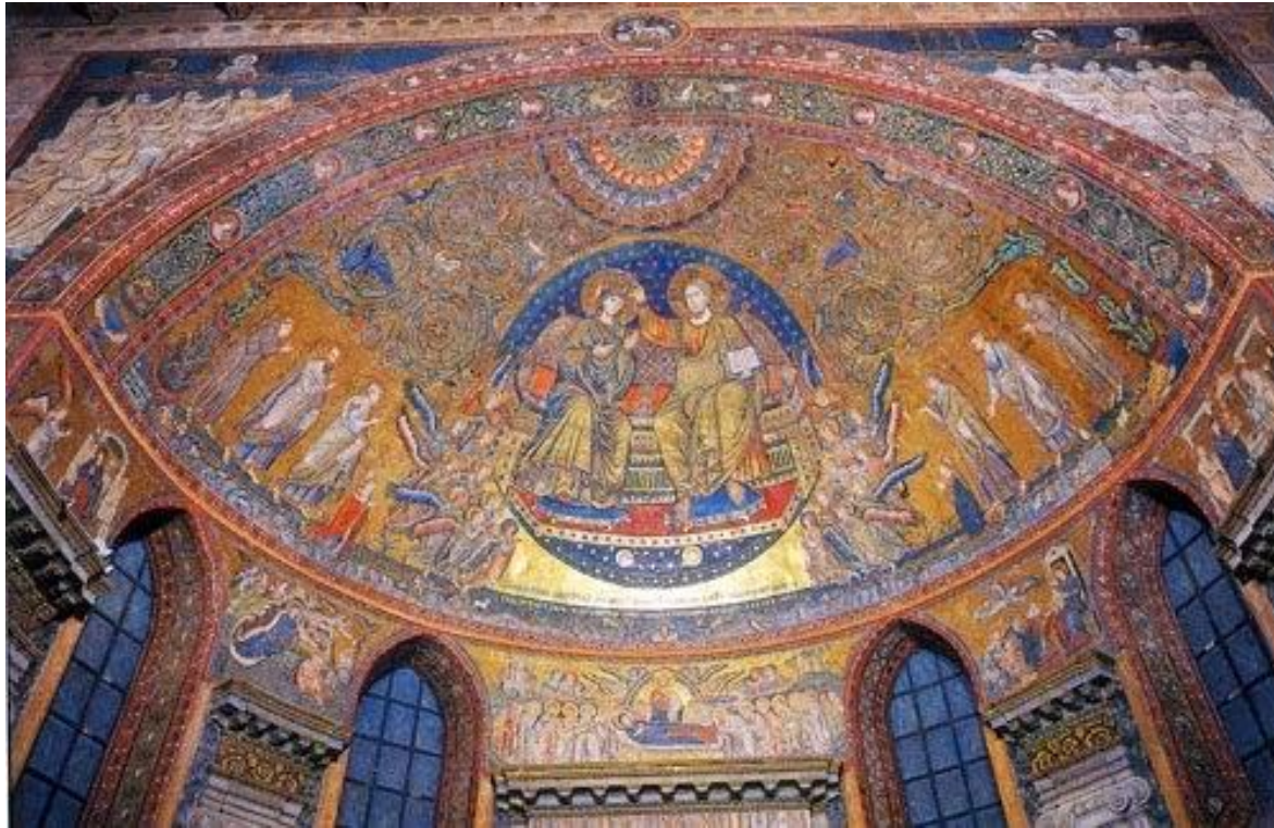
IGLESIA SANTA MARIA LA MAYOR

LA PINTURA Y MOSAICOS EN MURALES, BASANDOSE EN TECNICAS ROMANAS, PERO CON TEMAS RELIGIOSOS