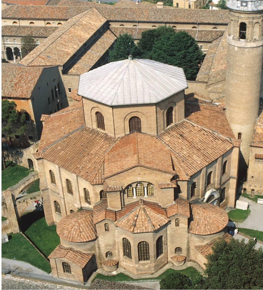
SAN VITAL DE RAVENA