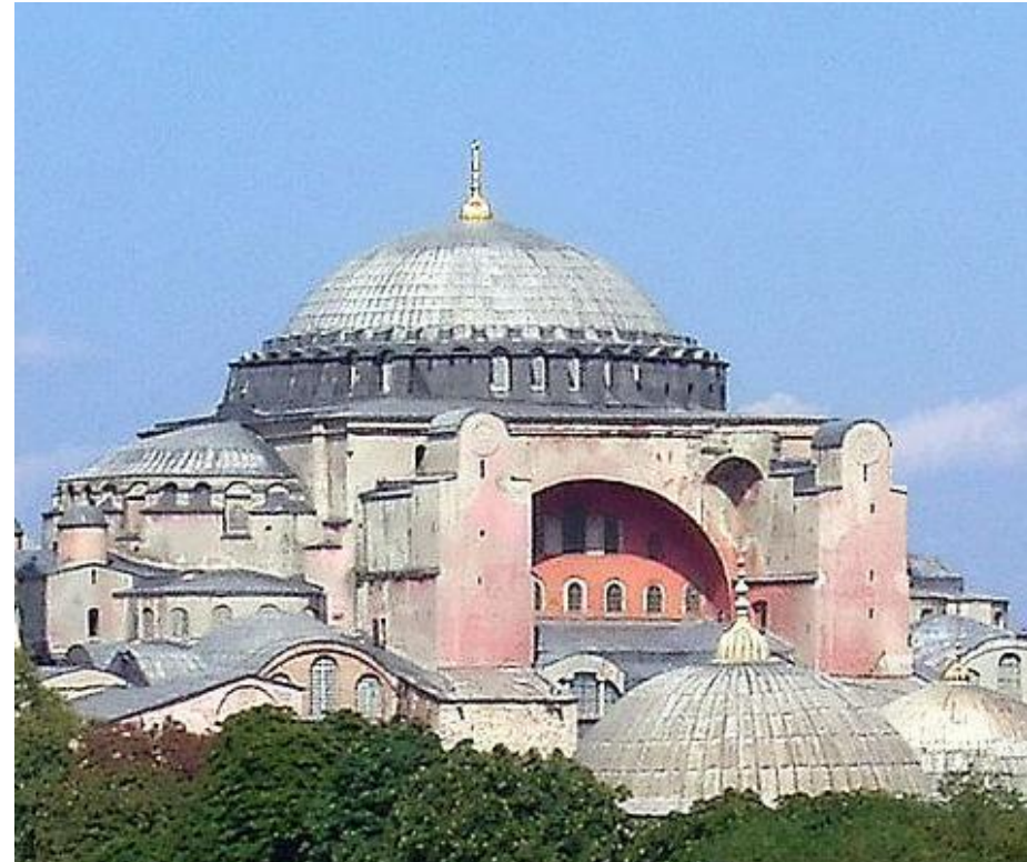
SANTA SOFIA CONSTANTINOPLA