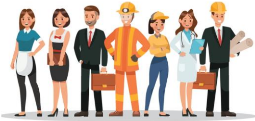
Son los emprendedores, profesionistas independientes y asalariados.