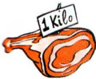
a kilo of meat