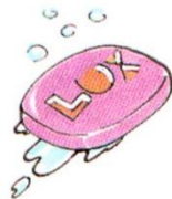
a bar of soap