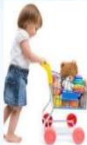
Gustos- hábitos e Intereses