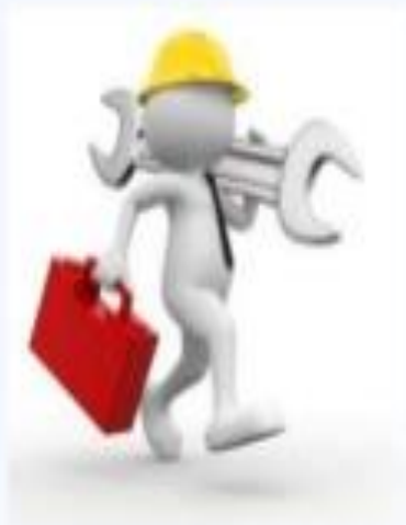
Experiencias y trabajo laboral