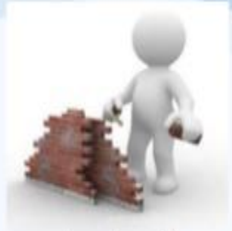
La educación debe ser reconstruida