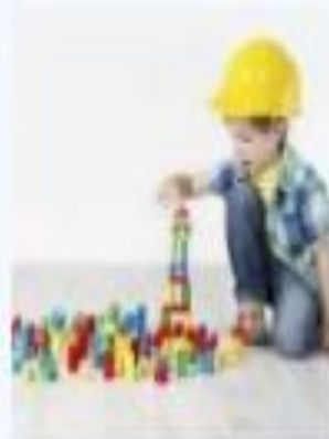
Estimular al niño