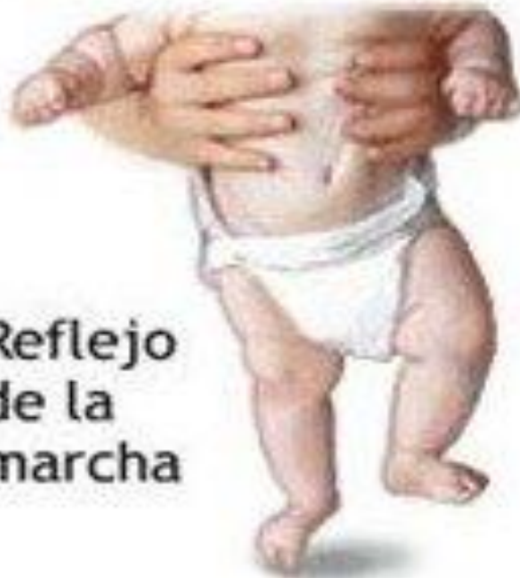
Reflejo de la marcha