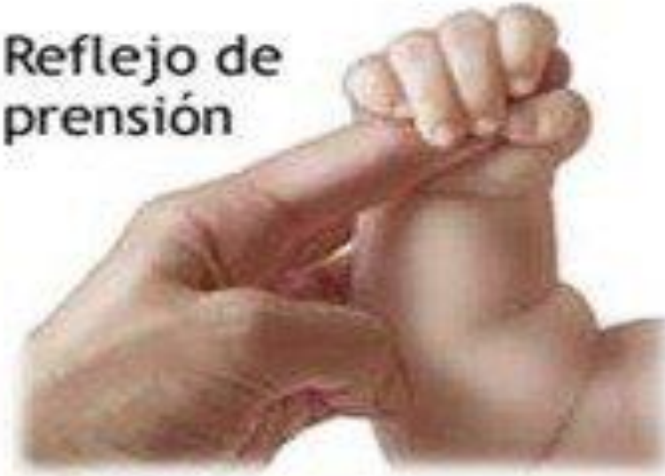
Reflejo de prensión