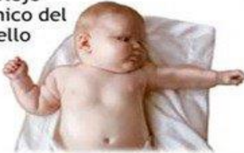
Reflejo tónico del cuello