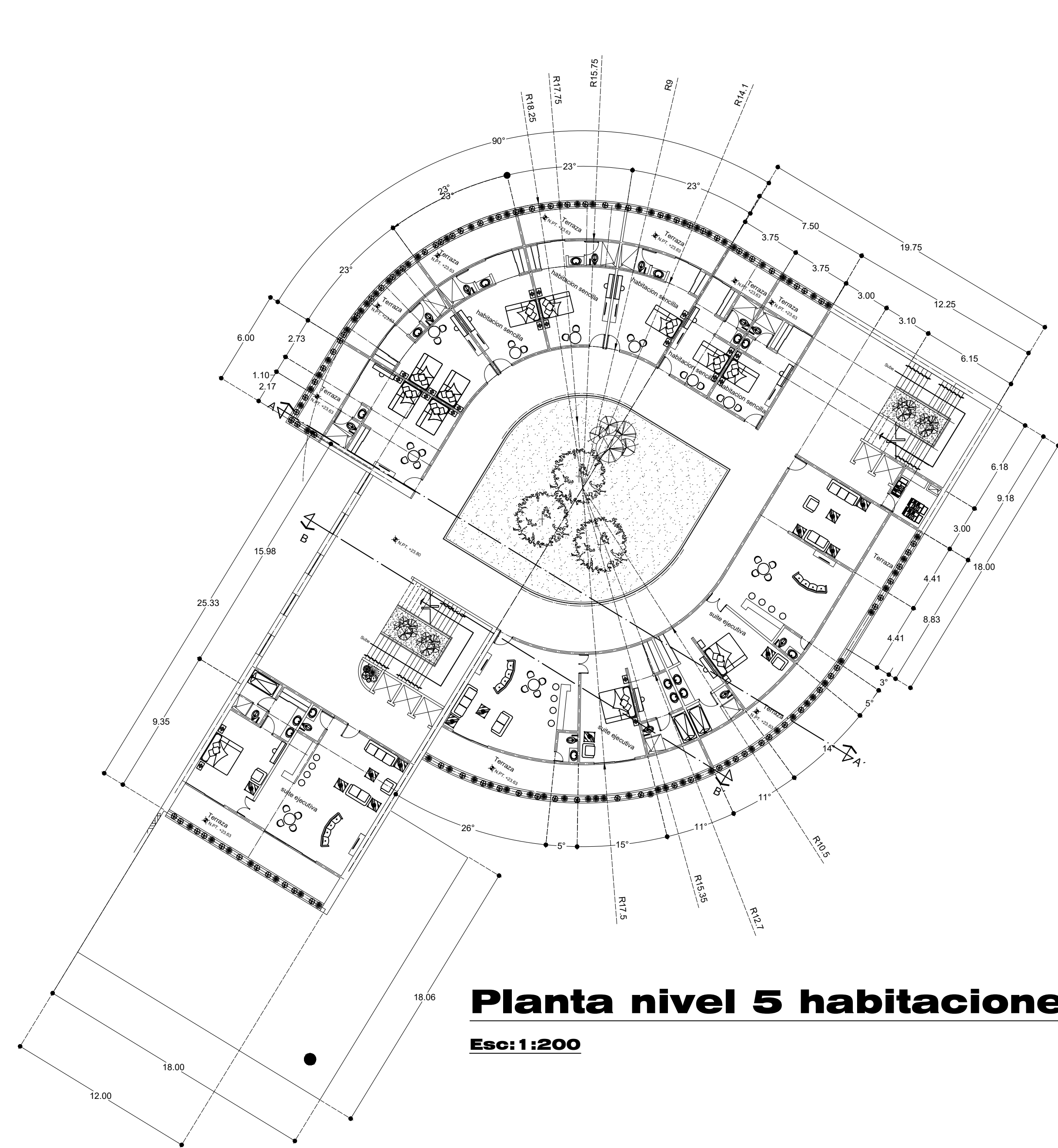
Planta nivel 5 habitaciones