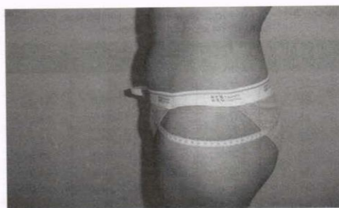
• Figura 5-3. Sitios y forma adecuados para medir las circunferencias de cintura y cadera.