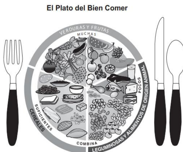
Figura 3-6. Plato del bien comer (Norma Oficial Mexicana NOM-043-SSA2-2012, Servicios básicos de salud. Promoción y educación para la salud en materia alimentaria. Criterios para brindar orientación. Publicación en el Diario Oficial de la Federación; 22 de enero de 2013).

El plato del bien comer o representación gráfica de los grupos de alimentos en México, como se puede observar en la figura 3–6, es la forma de clasificar los alimentos de acuerdo a su composición, oficialmente validada en la Norma Oficial Mexicana para brindar orientación alimentaria. La imagen es un círculo dividido en tres partes iguales de tres colores: verde, amarillo y rojo, conforman el grupo 1; verduras y frutas, el grupo 2; cereales, leguminosas y alimentos de origen animal, el grupo 3. El círculo tiene una base interior dividida por los mismos colores, pero en cinco partes delimitadas con otro color que es el blanco, con lo que se logra fraccionar a la perfección las porciones en el interior del Plato. Cada división muestra un grupo de alimentos con dibujos de los mismos e identificados con sus nombres en el borde exterior: