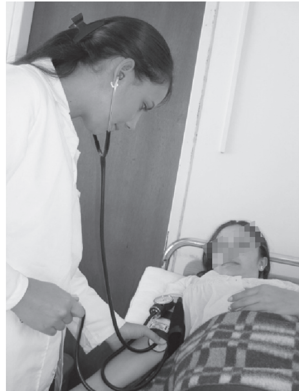
Figura 5. Toma de la PA en el brazo.

Arteria braquial o humeral (ver Figura 5), arteria femoral, arteria poplítea y arteria tibial como las más asequibles. 37, 38, 41