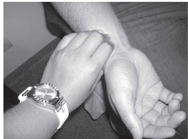
Figura 2. Pulso radial (Arteria radial)

Pulso temporal (arteria temporal), pulso carotideo (arteria carótida), pulso braquial (arteria humeral), pulso radial (arteria radial), pulso femoral (arteria femoral), pulso poplíteo (arteria poplíteo), pulso pedio (arteria pedia), pulso tibial (arteria tibial posterior) y pulso apical (en el ápex cardiaco), como los más comúnmente empleados. (Figura 2). 36, 37, 38