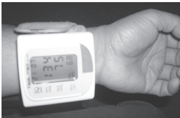
Figura 4. Monitor de la presión de muñeca.

Se cuenta con sistemas invasivos que se realizan a través de la canalización de una arteria conectada a un transductor. Útil en servicios especializados como Unidad de Cuidados Intensivos (UCI) y otros cuidados críticos. La presión arterial auscultatoria se determina mediante los ruidos que se producen cuando la sangre comienza a fluir a través de